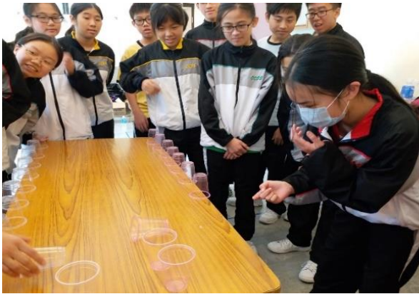
熱身活動 – Filp it