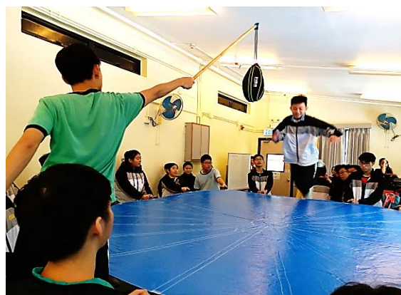
信心跳躍 Trust Fly